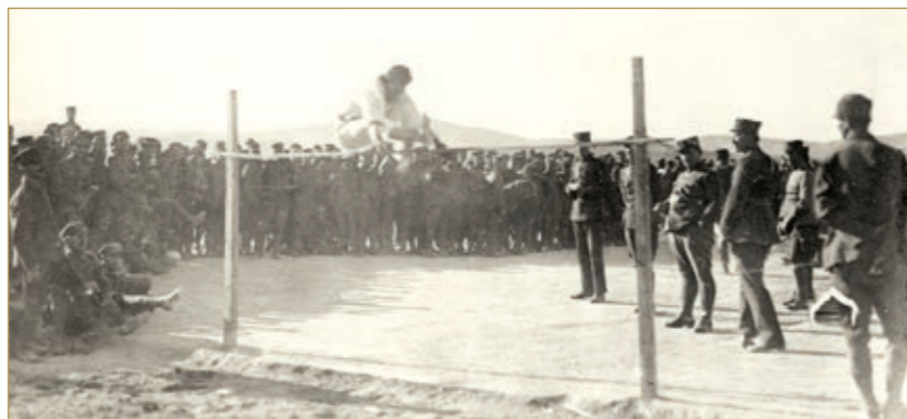
Ανεξάρτητος Μεραρχία. Αγώνες. Άλμα εις Ύψος