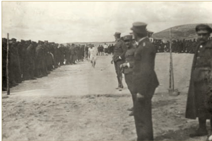
Ανεξάρτητος Μεραρχία. Αγώνες. Άλμα Τριπλούν