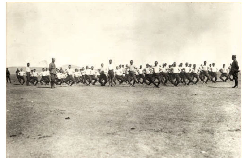
Ανεξάρτητος Μεραρχία. Γυμναστικές Ασκήσεις