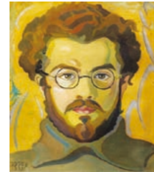
Αυτοπροσωπογραφία Πολύκλειτου Ρέγκου, 1927, ελαιογραφία.

ΥΑΠΑ/ΔΙΛΑΠ/2293/64900) η οποία δημοσιεύθηκε στο ΦΕΚ 117/Β/6-11-80. Αμέσως μετά την αποτοίχιση της «τετραλογίας», λόγω της κατεδάφισης του Στρατιωτικού Θεάτρου, την τελική συντήρηση και τοποθέτηση των τμημάτων της τοιχογραφίας σε κορνίζες, ανέλαβαν και έφεραν σε πέρας οι συντηρητές αρχαιοτήτων Διονύσης Καπιζιώνης και Θανάσης Παλούσης στο εργαστήριο τοιχογραφιών της 4ης Εφορείας Νεωτέρων Μνημείων. Οι συντηρημένες πλέον τοιχογραφίες περίμεναν έναν μόνιμο κατάλληλο χώρο για την οριστική τους τοποθέτηση. Το 1993 μετά από σχετικό έγγραφο του Πολεμικού Μουσείου Θεσσαλονίκης, ζητήθηκε η έκθεση να τοποθετηθεί στις αίθουσές του και έκτοτε παραμένει έως σήμερα. Οι τοιχογραφίες κατέχουν σημαντική θέση στο ζωγραφικό έργο του καλλιτέχνη. Έχει τοιχογραφήσει με νωπογραφίες (Fresques) στη Θεσσαλονίκη: το παρεκκλήσι του Αγίου Δημητρίου, τον Άγιο Στυλιανό, μικρό Ναό στο χώρο του Πανεπιστημίου Θεσσαλονίκης (1943), τον Ναό του Προφήτη Ηλία στο στρατιωτικό αεροδρόμιο του Σέδες (1954), επίσης στο Παρίσι τον καθεδρικό Ναό του Αγίου Στεφάνου και στην Ουάσιγκτον τον καθεδρικό Ναό της Αγίας Σοφίας.