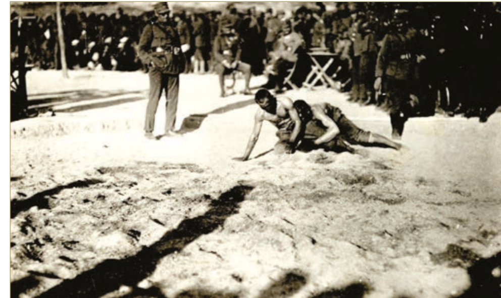
Ανεξάρτητος Μεραρχία. Αγώνες. Πάλη