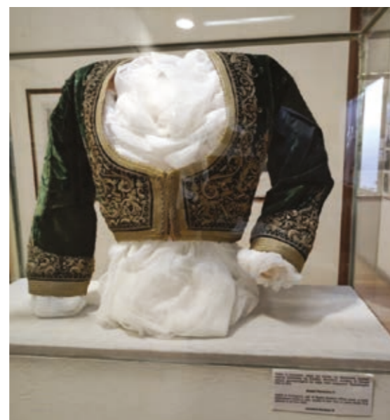
Γιλέκο ή κοντογούνι. Μέρος της στολής της Βασίλισσας της Ελλάδος Αμαλίας. Σε σκούρο χρώμα, χρυσοκέντητο & πάρα πολύ εφαρμοστό. Χρονολογείται από το 1839.