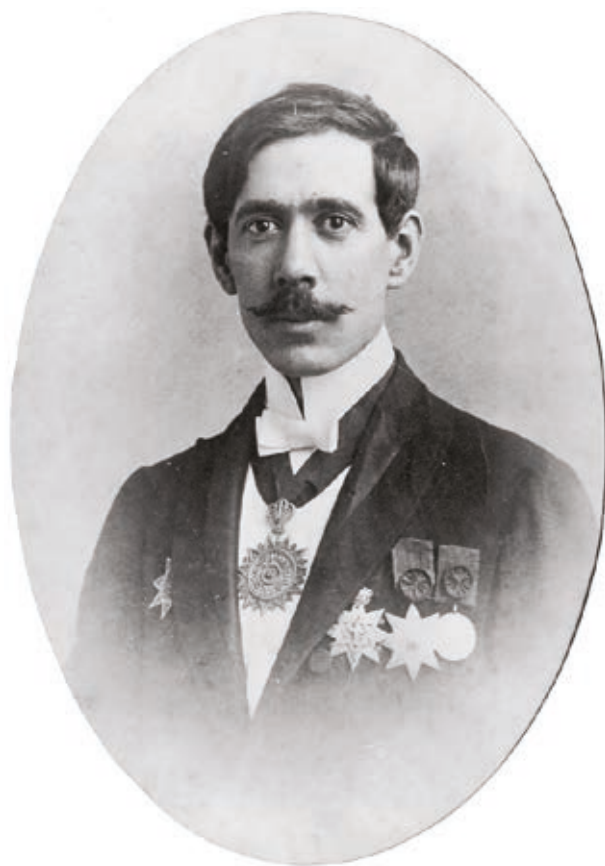
Γεώργιος Προκοπίου (Σμύρνη 1876 - Τεπελένι 1940)

Μετάλλιον Στρατιωτικής αξίας Πολεμικός Σταυρός.»