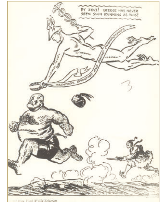
«Οι Ολυμπιακοί του 1940»

Μουσολίνι: «Το ξέρω ότι εγώ το άρχισα, δεν μπορείς όμως να τον σταματήσεις και να κάνεις να φανεί πως εγώ νίκησα.»