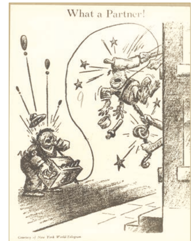
Ο Μουσολίνι σε διαμάχη με τον Χίτλερ