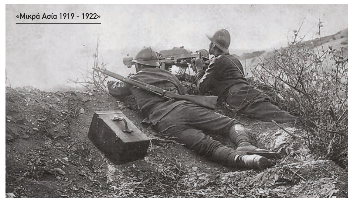
«Μικρά Ασία 1919 - 1922»

Ζωγράφος - Καλλιτεχνικός επιμελητής του Πολεμικού Μουσείου