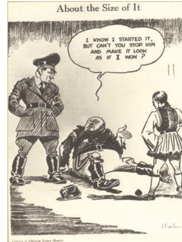
Μονομαχία Ελλήνων, Ιταλών επί παρουσία του Χίτλερ

Μουσολίνι: «Το ξέρω ότι εγώ το άρχισα, δεν μπορείς όμως να τον σταματήσεις και να κάνεις να φανεί πως εγώ νίκησα.»